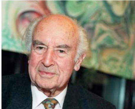
«LSD wurde zu einer politischen Gefahr für Amerika»: Albert Hofmann, rüstiger Jubilar.

BASEL – Der «Vater des LSD», Albert Hofmann, hat heute seinen 100. Geburtstag gefeiert. Und beschrieben, was er damals für einen Rausch durchlebt hat. Zudem kämpft er für sein «Kind».