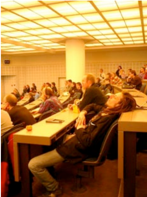
Zu müde für psychedelische Revolution

Ernst Jünger nahm einen der ersten kontrollierten LSD-Trips zusammen mit seinem Freund Albert Hofmann, die Frau von Jünger sprach von "pubertärem Gehabe". Die beeindruckende Wirkung stieß in den 50er Jahren auf großes Interesse bei Intellektuellen, Künstlern und spirituell Interessierten, deren Berichte eine breite Öffentlichkeit neugierig machten. Der Weg für LSD als Volksdroge der 60er Jahre war geebnet. Die transformatorischen Erfahrungen auf der persönlichen Ebene schrien geradezu nach einer Umgestaltung der als spießig, lustfeindlich und entspiritualisiert empfundenen "spätkapitalistischen" Gesellschaft. Das Hippie-Zeitalter begann. In den USA rief Timothy Leary zum "Turn On, Tune In, Drop Out" auf, Vietnam-Protest und LSD verwoben sich zu einer politischen Bewegung, die ein radikal neues Lebensgefühl propagierte.